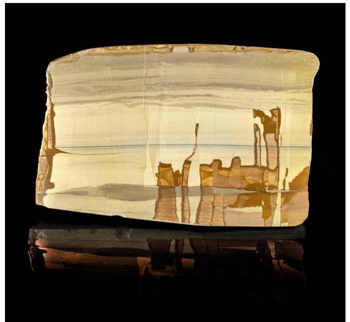
Figure 2. « Solitude géologique », calcaire paésine (Toscane, Italie). François Farges. Paris, MNHN (mécénat EAJ/VC&A, 2017).

Caillois a été élu à l'Académie française en 1971 quand les pierres sont devenues essentielles pour l'essor de sa prose (1952-1978). Ses pierres nourrissent ses écrits, jamais minéralogiques, mais plutôt d'histoire de l'art, avec une écriture singulière qui transcende notre vision de ces précieux témoins géologiques : « L'agate de Pyrrhus » des Grecs, les « pierres de rêve » des chinois et les paésines de la Renaissance (figure 2). Pierres (1966) et L'Écriture des pierres (1970) sont ses ouvrages les plus connus et les plus traduits sur le sujet.