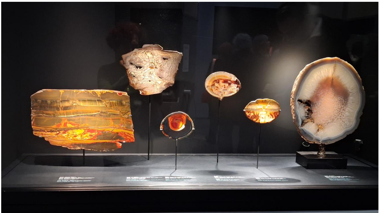
Une vitrine dans l'exposition « Rêveries de pierres », présentée à l'École des Arts Joailliers, en 2025-2026. À gauche, jaspe Marra-Mamba, Australie ; au-dessus, un peu à droite, jaspe de Biggs, Comté de Deschutes, Oregon Et, tout à droite, l'« Agate blessée ».