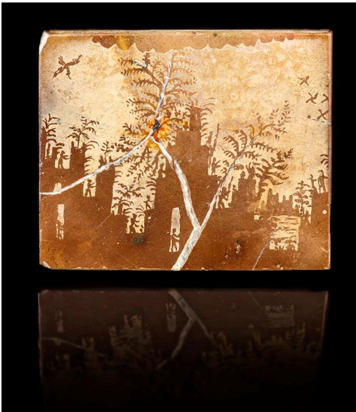
Figure 3. Le Château », calcaire lithographique (origine possiblement allemande). François Farges. Paris, MNHN (mécénat EAJ/VC&A, 2017).

En 2017, l'autre partie de la collection de pierres de Caillois, qui était restée dans les mains de ses héritiers, a été acquise, par mécénat, pour le MNHN par la Maison Van Cleef & Arpels via l'École des arts joailliers. Ce corpus contient de nombreux spécimens illustrés dans l'Écriture des pierres , mais jamais exposés auparavant, comme le calcaire à dendrites « Le Château », peut-être la pierre de Caillois la plus connue au monde (figure 3). Cette donation inclut le catalogue manuscrit de sa collection, dont l'agate « n° 2.193 » dont la description permet enfin de l'identifier.