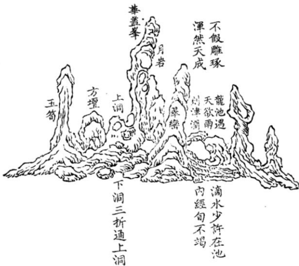
Figure 5. « Pierre à encre de l’atelier de Baojin » de la collection de Mi Fu (1051-1107).

Mais Caillois s’inspire également de Mi Fu (1051-1107), ce lettré chinois de la dynastie Song du Nord qui se livrait à des rêveries sur les pierres. Cet érudit se prosternait devant la pierre la plus importante de sa collection, appelée 寶晉齋研山 ce qui signifie « pierre à encre de l’atelier de Baojin », et qui est devenue cultissime en Chine, encore de nos jours. Elle a été perdue de vue au XIX e siècle mais quelques gravures médiévales subsistent, dont la plus ancienne trouve son origine en 1366 (figure 5).