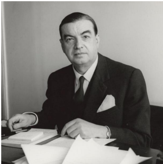
Figure 1. Roger Caillois à la maison de l'UNESCO, à Paris (1962).

Entre 2017 et 2023, deux grands événements ont bouleversé la perception de l'univers géopoétique de Roger Caillois, au Muséum national d'histoire naturelle : l'acquisition du noyau de sa collection de pierres en 2017 et la découverte de manuscrits inédits en 2023. Ces découvertes ont fait l'objet d'une exposition « Rêveries de pierres », d'une publication inédite ( Pierres anagogiques ) et d'une anthologie ( Chuchotements & Enchantements ).